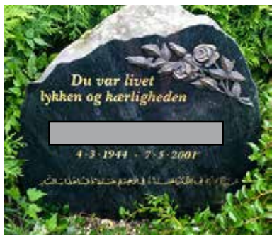
Figur 2. Gravsten, Vestre Kirkegård. Arabisk tekst: Sura 2:201: "Beskyt os mod ilden (helvedet) – ildens pinsler." Navnet på den begravede er anonymiseret af forfatteren.