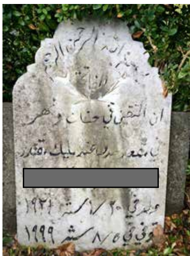
Figur 3. Gravsten, Vestre Kirkegård. Arabisk tekst: Øverst: "I Allah den nådige den barmhjertiges navn"; midt på: Al-fatiha – indgangsbønnen/åbningskapitlet i Koranen: "I den nådige og barmhjertige Guds navn..."

man både vender blikket mod det jordiske liv og livet efter døden. Citatet skal i denne sammenhæng forstås i sin kontekst fra sura 2 inklusive vers 200: